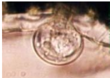
Capitata trichome (L. Basil)

Les trichomes (poils épidermiques) font partie des caractéristiques les plus saillantes à la surface d'une plante. L'apparence "velue" de plusieurs plantes communes est due à la présence de trichomes. Les trichomes glandulaires contiennent les huiles volatiles et autres sécrétions recouvrant la surface des feuilles et des pétales. Les plantes aromatiques (comme le Lavandin) et les herbes culinaires (telles la famille de la menthe, le thym, la sauge, etc.) contiennent toutes des huiles essentielles à l'intérieur des cellules formant le globe des trichomes glandulaires.