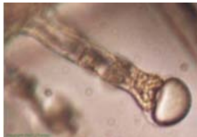
Peltate trichome from Ocimum ssp. (Basilic citronné)

Les diagrammes qui suivent démontrent deux catégories courantes de trichomes glandulaires chez l' Ocimum (Basilic citronné); classifiés peltate ou capitata selon leur morphologie: