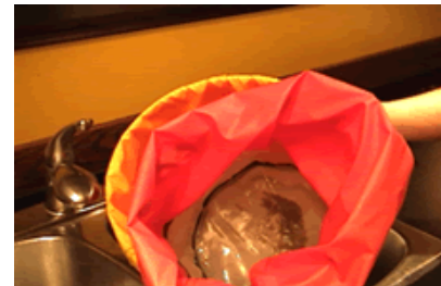
Après - After