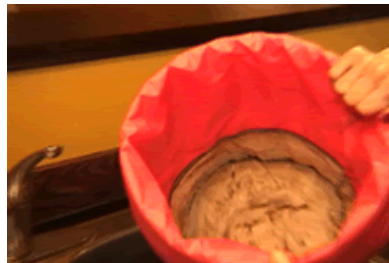
Avant – Before